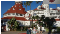
Hotel Del Coronado San Diego