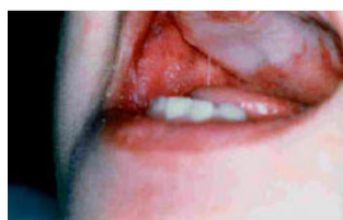
口腔内のコプリック